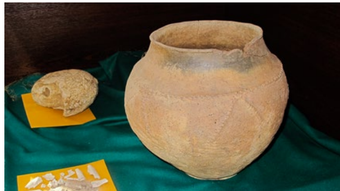
Klosz, element grobu kloszowego; przykrywał popielnicę ze spalonymi szczątkami; zbiory Siennickiego Muzeum Szkolnego

poł. V do poł. VI-VII w.), kolejnymi mieszkańcami tych ziem stopniowo stawali się Słowianie. Zajmowali oni nowe tereny poprzez wypalanie roślinności. W pierwszym okresie uprawiano zboża, len, konopie oraz warzywa. Hodowano zaś bydło, świnie, owce, kozy oraz drób. Preferowano miejsca w pobliżu rzek i strumieni, mieszkało w ziemiankach, półziemiankach oraz chatkach naziemnych, tworzących małe osiedla,