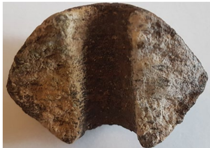
Fragment obciążnika do przęsłika, epoka brązu; znaleziony w rzece Świder w okolicach Dłużewa; zbiory Muzeum Ziemi Mińskiej w Mińsku Mazowieckim

ską luźne, przypadkowe (głównie monety), poświadczające obecność osadnictwa ludności, która zajmowała się np. wytopem żelaza. Miejsce ludności kultury przeworskiej zajęła następnie społeczność wiązana z plemionami gockimi, wędrującymi z północy w kierunku Morza Czarnego. Po ich odejściu i przerwie osadniczej (od