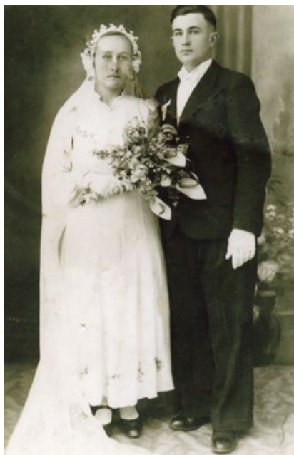
Ślub, Siennica, 1942 r.