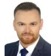
Wójt Gminy Siennica