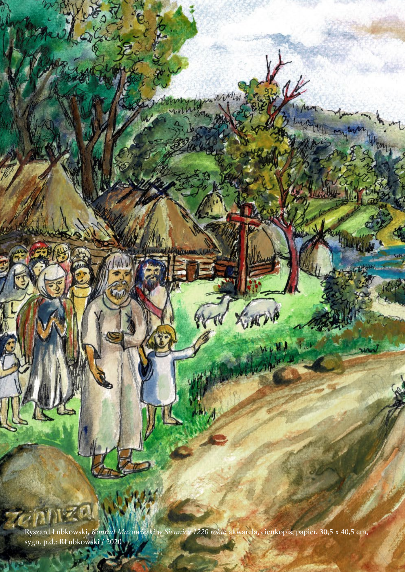
Ryszard Łubkowski, Konrad Mazowiecki w Siennicy 1220 roku ; akwarela, cienkopis, papier, 30,5 x 40,5 cm, sygn. p.d.: RŁubkowski / 2020