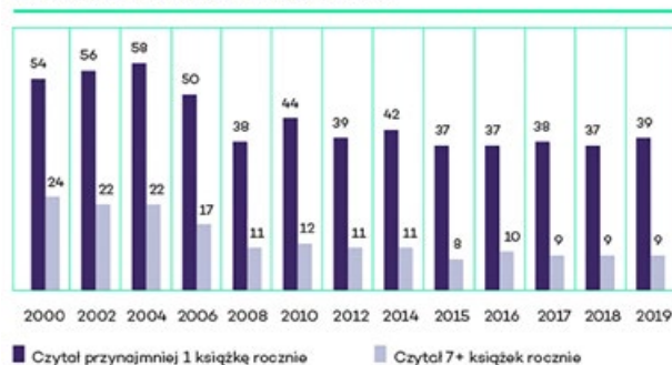
Czytanie książek w latach 2000-2019 (dane w proc.)

Jak wynika z raportu Biblioteki Narodowej, w 2019 r. można odnotować trwałe zatrzymanie spadku czytelnictwa, a nawet niewielki wzrost deklaracji czytelnicych (39%). Jest to w pewnej mierze wynik dobrej koniunktury, która pozwoliła na wzmożone zakupy nowości książkowych, ale również podsycała zainteresowań czytelnicych przez ekranizacje, seriale czy gry komputerowe. Niewątpliwie znaczącą rolę w kształtowaniu gustów czytelnicych mają prestiżowe nagrody literackie, jak Nagroda Nobla dla Olgi Tokarczuk.