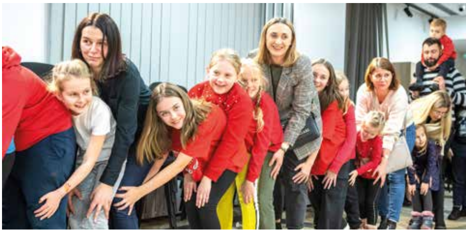
„Wydarzenie zostało sfinansowane ze środków Gminy Siennica.”

Bardzo dziękujemy uczestnikom spotkania za wyjątkową atmosferę i tak czynny udział rodziców w zabawach z dziećmi.